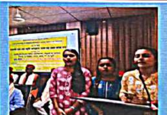
Welcome song by Student Address by a Student